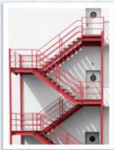
Наружная открытая эвакуационная лестница

б) организуют не реже 1 раза в 5 лет проведение эксплуатационных испытаний пожарных лестниц металлических , наружных открытых лестниц, предназначенных для эвакуации людей из зданий и сооружений при пожаре, ограждений на крышах с составлением соответствующего протокола испытаний и внесением информации в журнал эксплуатации систем противопожарной защиты.