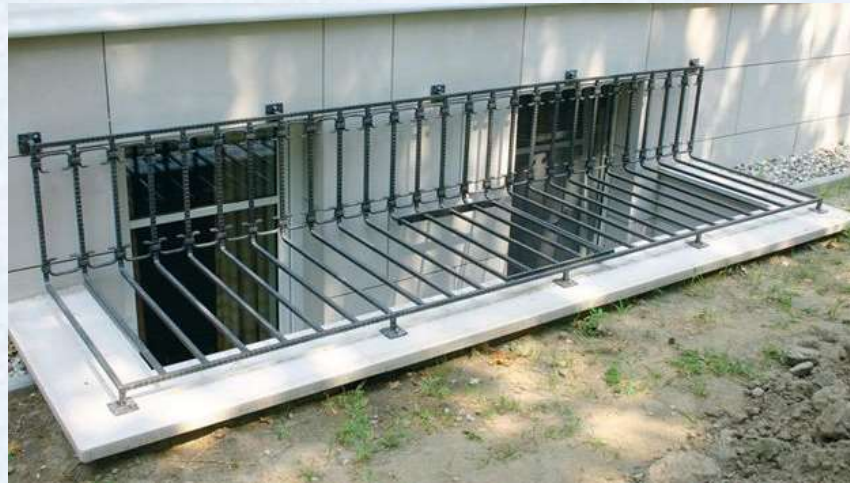
Глухие решётки у прямков окон подвалов

г) устанавливать глухие решетки на окнах подвалов и прямках у окон подвалов, являющихся аварийными выходами, за исключением случаев, специально предусмотренных в нормативных правовых актах Российской Федерации и нормативных документах по пожарной безопасности;