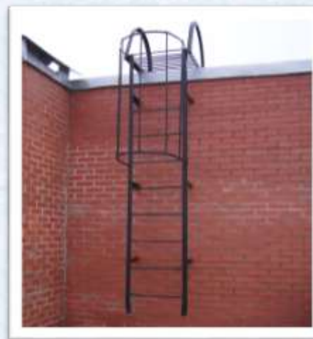
Наружная пожарная лестница